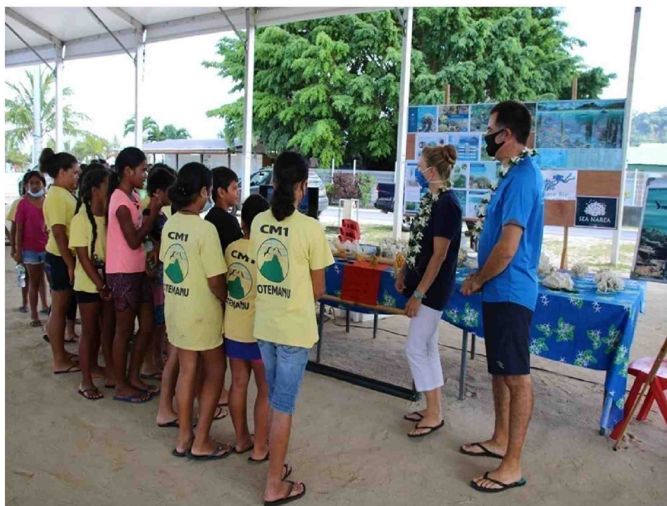
Les scolaires ont participé à différents ateliers.

BORA BORA - Des ateliers installés sur la place Tuvavau.